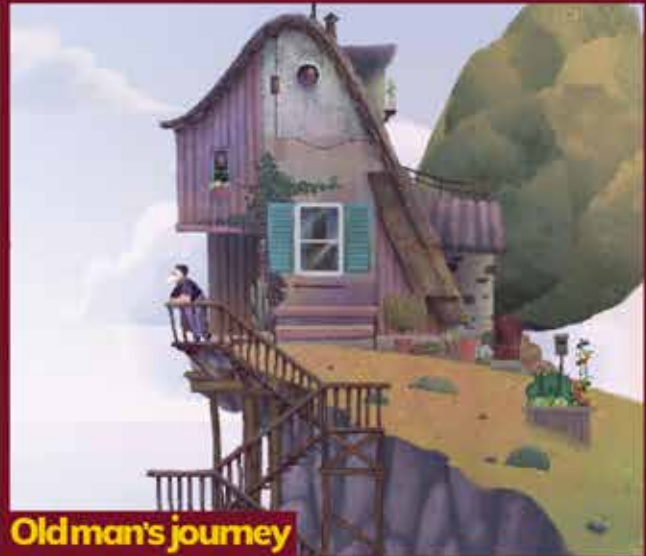
Old man's journey